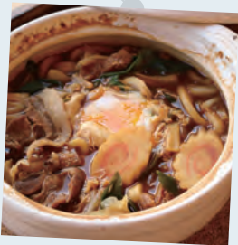
しし煮込みうどん

竹の中に入れてフェルトを使ったお内裏様とお雛様をならべる竹雛作り体験。今年は2月13日（日）・20日（日）・23日（水祝）の3日間開催いたします。玄関先などにちよこっと飾れるコンパクトなサイズは持ち運びも便利、誰でも楽しく作れますよ。是非ともご参加お申込みください。